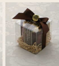
花びらの コンフィチュール 70g