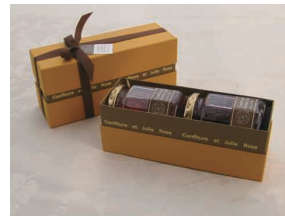
3. 生ジャム 2個セット