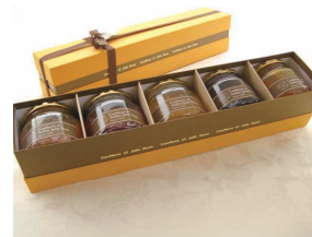
8. 生ジャム大ビン5個セット

生ジャム140g×4個 ローズティー45g×1個 ギフトボックス入 3,500円～