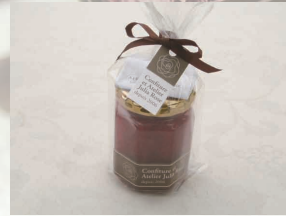
1. 生ジャム 1個