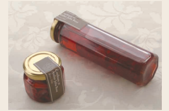
薔薇の雫2点セット

ローズシロップ 200g×1個 花びらのコンフィチュール 70g×1個 ローズティー45g×1個 ギフトボックス入 3,600円