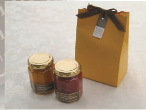
2. 生ジャム 2個セット