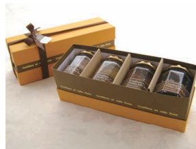
5. 生ジャム 4個セット