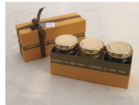
4. 生ジャム 3個セット