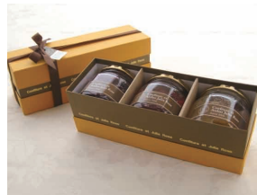
6. 生ジャム大ビン3個セット