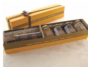
7. 生ジャム&ローズティーセット

生ジャム140g×4個 ローズティー45g×1個 ギフトボックス入 3,500円～