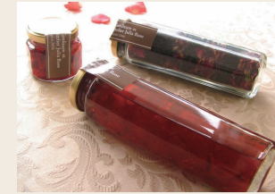
薔薇の雫3点セット

ローズシロップ 200g×1個 花びらのコンフィチュール 70g×1個 ローズティー45g×1個 ギフトボックス入 3,600円